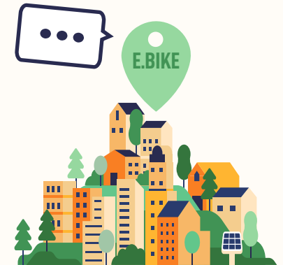
VILLANUEVA DE SIGENA